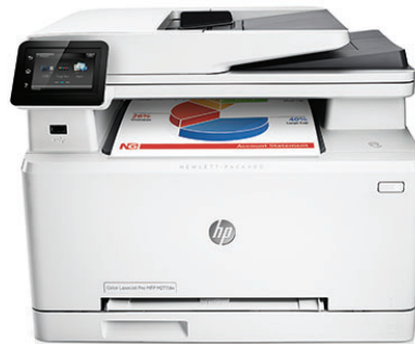
HP Color LaserJet Pro MFP M277dw

Enorme Leistungsfähigkeit im kompakten Design. Der funktionsreiche MFP ermöglicht in Verbindung mit Original HP Tonerkartuschen mit JetIntelligence die erfolgreiche Ausführung von Druckaufträgen.